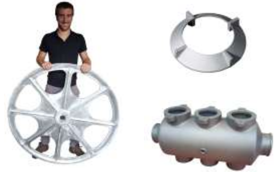
Pièces mécaniques / Mechanical parts

Pièces architecturales de toutes dimensions et formes Architectural pieces of all sizes and shapes