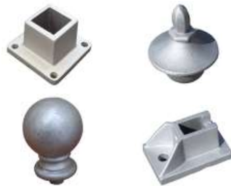
Escaliers, rampes et balcons Stairs, ramps and balconies

Une gamme complète de mobilier urbain Architectural pieces of all sizes and shapes