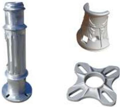
Architectural / Architectural

Pièces architecturales de toutes dimensions et formes Architectural pieces of all sizes and shapes