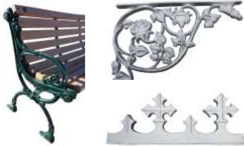
Mobilier urbain / Urban furnitures

Pièces mécaniques avec usinage selon vos besoins Parts with machining according to your needs